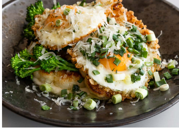
Brokuł i kalafior Broccoli and cauliflower