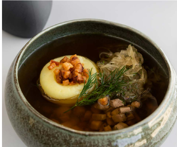
Kwaśnica Sourkraut soup