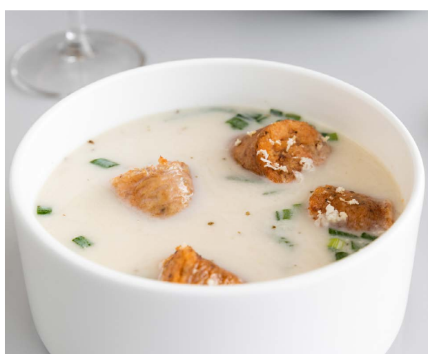
Barszcz biały White borscht