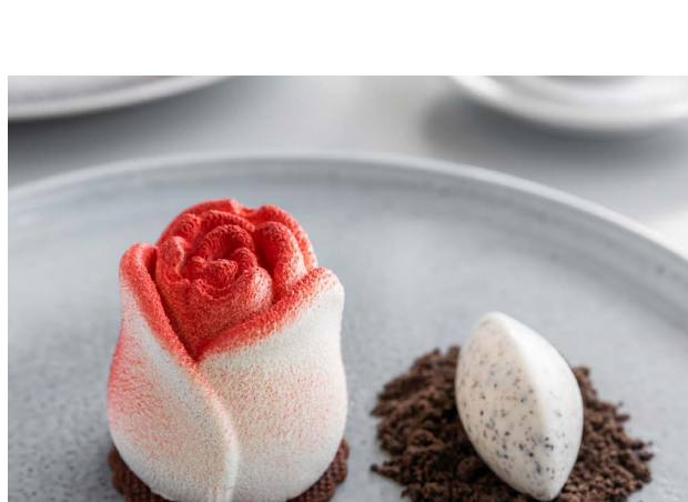
Monoporcja różana Rose monoportion