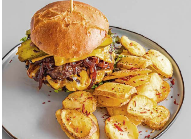
Smash Burger Smash Burger