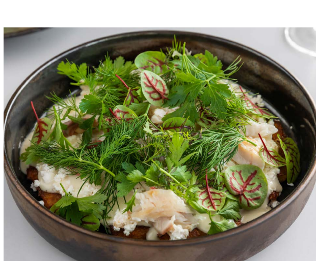
Placek ziemniaczany Potato pancakes