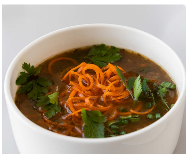
Flaczki z boczniaka Oyster mushroom soup