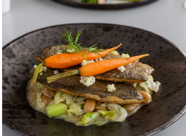
Filet z pstrąga Broccoli and cauliflower