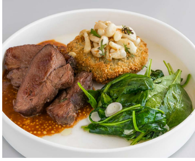
Biodrówka jagnięca Lamb hip