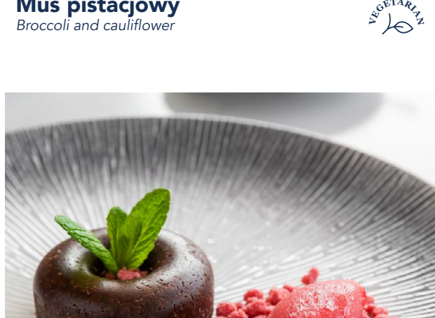
Pralina migdałowa Almond praline