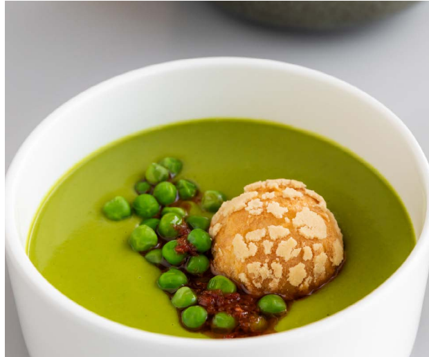
Krem z zielonego groszku Green peas cream soup