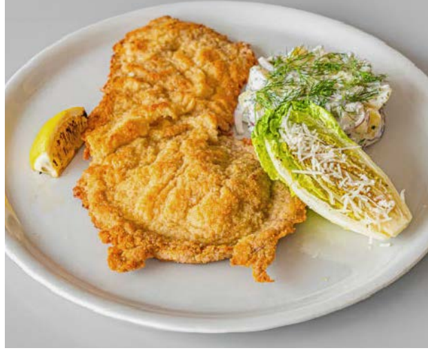
Szyncel cielęcy Veal schnitzel