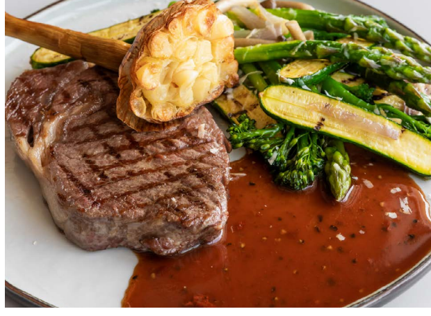
Antrykot wołowy Beef entrecote