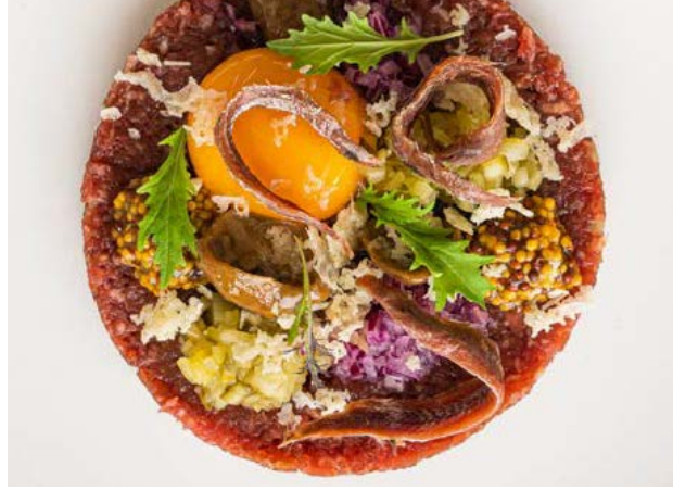
Tatar wołowy Beef tartare