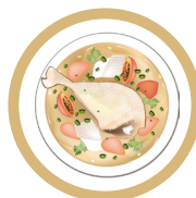
Rosół (Chicken soup)