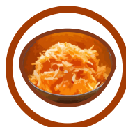
Surówka z marchewki i jabłka (salad with carrots and apples)