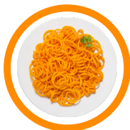
Spaghetti z sosem pomidorowym (Pasta with tomato sauce)