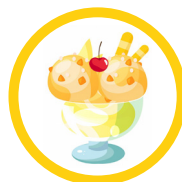
Lody (Ice cream)