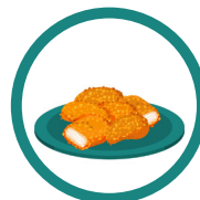
Nugetsy (Chicken nuggets)