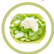
Świeży ogórek ze śmietaną (Fresh cucumber with sour cream)