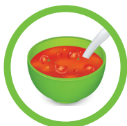
Zupa pomidorowa z ryżem (Tomato soup with rice)