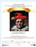
Dyplom „Piękniejsza Polska” Odrestaurowany zabytek