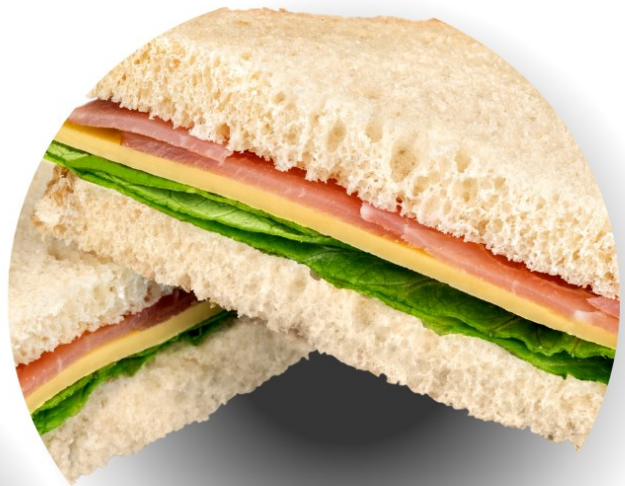
z chlebem tostowym