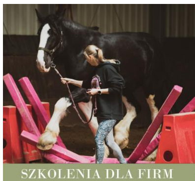
SZKOLENIA DLA FIRM