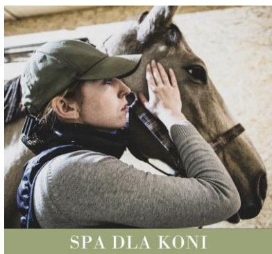
SPA DLA KONI