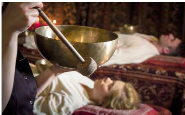
📍 Masaż dźwiękiem.

Manor House – od lat najlepszy holistyczny hotel SPA w Polsce i prawdziwa enklawa dla dorosłych – to idealny adres na odpoczynek we dwoje. Przyjemne będą relaksujące masaże, także w wersji dla dwojga, energetyczne terapie i zabiegi