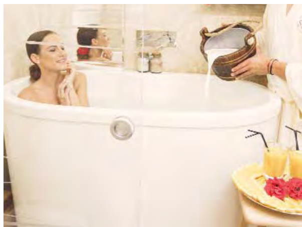
📍 Kąpiel ofuro.