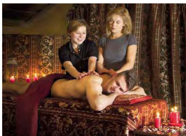
📍 Masaż dla dwojga. Biowitalne SPA.

odmładzające w Biowitalnym SPA oraz dobroczynne dla zdrowia, urody i samopoczucia kąpiele w zaciszu pokoju.