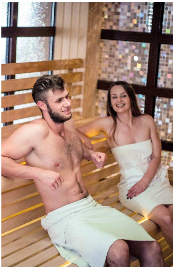
📍 Łaźnie Rzymskie.