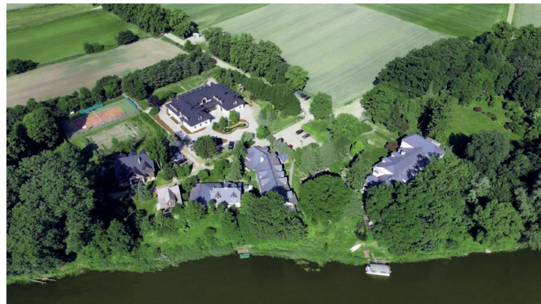
▲ Kompleks Dworu w Zabuzu położony nad samym Bugiem

Uzupełnienie zabiegów upiększających stanowi strefa wellness, na którą składają się basen wewnętrzny, jacuzzi, łaźnia parowa, basen zewnętrzny z podgrzewaną wodą, sauna sucha i jaskinia solna. Poza pakietami i ceremoniami spa Dwór w Zabuzu oferuje wiele atrakcji łączących wypoczynek z rytuałami pielęgnacyjnymi. Najbliższą pro-