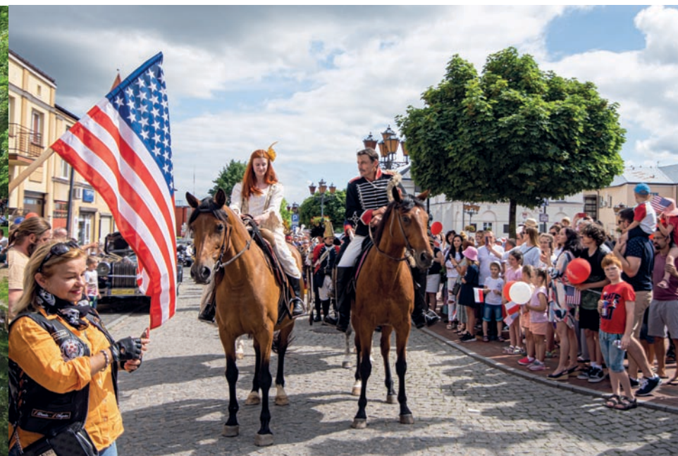
▲ Widowiskowa parada uświetniająca lipcową imprezę zatytułowaną Vivat Pułaski, wyruszająca z Rynku w Warce

szansa na wzrost liczby turystów. Poprzedni zwycięzcy odnotowywali kilkunastoprocentowy wzrost ruchu turystycznego. Fenomenem okazał się Zagrzeb, który przez kolejne trzy lata zwyciężał w kategorii Best Christmas Markets (w 2023 r. wygrał Budapeszt, a druga pozycja przypadła naszemu Gdańskowi). Liczba przyjeżdżających do niego turystów zwiększyła się o ok. 41 proc.