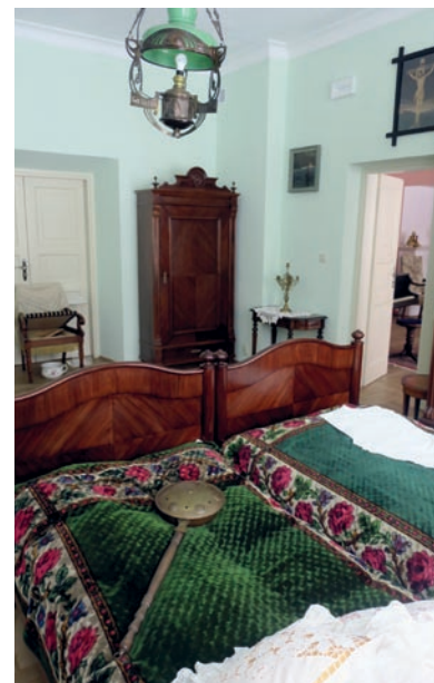
▲ Aranżacja sypialni w Muzeum Ziemiaństwa w Dąbrowie

leżą też staw i oczko wodne. W Muzeum Ziemiaństwa w Dąbrowie można wypożyczyć łódkę lub rower wodny, a spacer zakończyć na znajdującej się na środku stawu wysepce z altanką ( www.muzeumdabrowa.pl ). Do