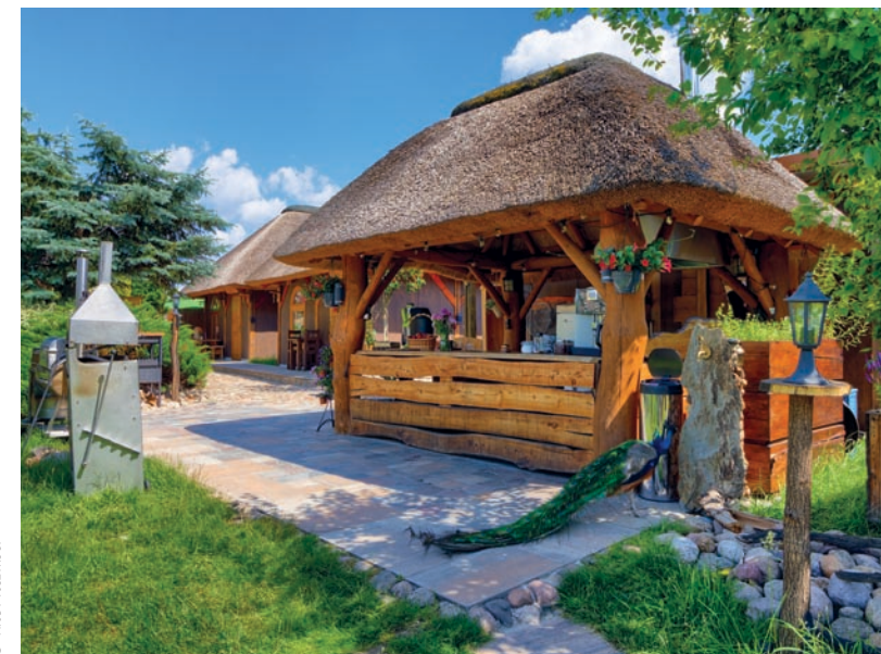
▲ Mirabelkowe Zacisze w miejscowości Zbrosza Duża