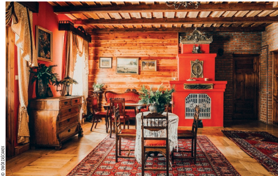
▼ Gospodarze Dworu Zaścianek sami wypiekają chleb i przygotowują własne przetwory z owoców i warzyw