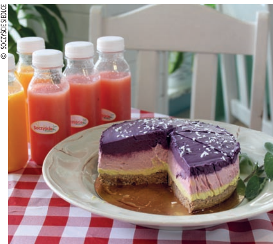
▲ W „Soczyscie Siedlce” kupimy witarianiejskie torty