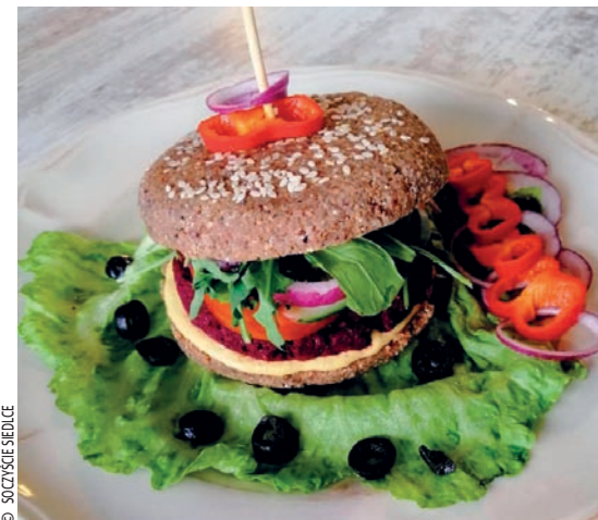
▲ Witarianiejski burger z lokalu „Soczyscie Siedlce”