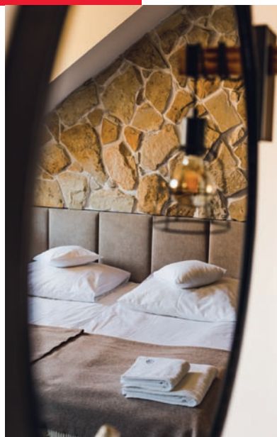
▲ Komfortowy pokój dla gości w Dworze w Zabuzu

Zabuzę Dwór Wellness & Spa wyróżnia się holistycznym podejściem do pielęgnacji ciała i duszy. Zapropionowane ceremonie spa pozwalają uciec przed codziennością i stresem, zrelaksować się oraz poczuć magiczną moc polnych ziół i najlepszych produktów, którymi obdarowała nas przyroda. Poza masażami relaksacyjnymi tutejsze centrum wellness i spa oferuje szereg zabiegów, które bazują na składnikach naturalnych. Jednym z nich jest pielęgnacja ciała z wykorzystaniem płatków róży z zastosowaniem białej gliny lub kąpiel w kozim mleku. Z kolei zabieg z lawendą działa relaksacyjnie i wyciszająco, a rytuał Herbaciany Ogród przenosi nas do Kraju Kwitnącej Wiśni. Podczas tego ostatniego wykorzystuje się antyoksydacyjne działanie zielonej herbaty. Wiele zabiegów pielęgnacyjnych posiłkuje się dobroczynnym działaniem owoców oraz mineralnych składników aktywnych. Należy do nich Szafirowy Dotyk Odnowy, który rozpoczyna się od peelingu z pomarańczą, pestkami moreli i winogron, które nie tylko oczyszczają, wygładzają i nawilżają skórę, lecz także ją odnawiają i dotleniają, dzięki czemu mamy poczucie odprężenia. Następnie na ciało aplikowana jest maska z pyłem szafirowym, a na zakończenie wykonuje się masaż wzbogacony oliwką z macthem. Jeden z najcenniejszych zabiegów