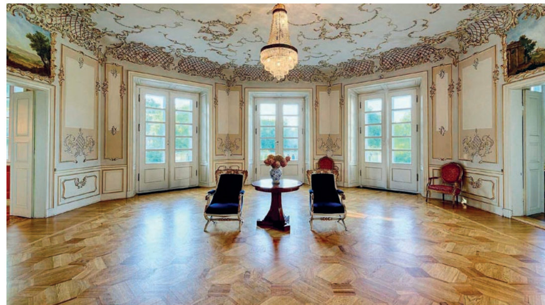
▼ Bogato zdobiona sala balowa w Pałacu w Korczewie

pozycją tego typu jest Majówka w Zabuzu (30.04–03.05.2023 r.), a kolejną – Boże Ciało w Zabuzu (09–11.06.2023). Sąsiedztwo Parku Krajobrazowego Podlaski Przełom Bugu oraz bliskość Wschodniego Szlaku Rowerowego Green Velo zachęcają do wycieczek i poznania tej zjawiskowej krainy nad rzeką Bug, zaliczaną do najpiękniejszych w Polsce.