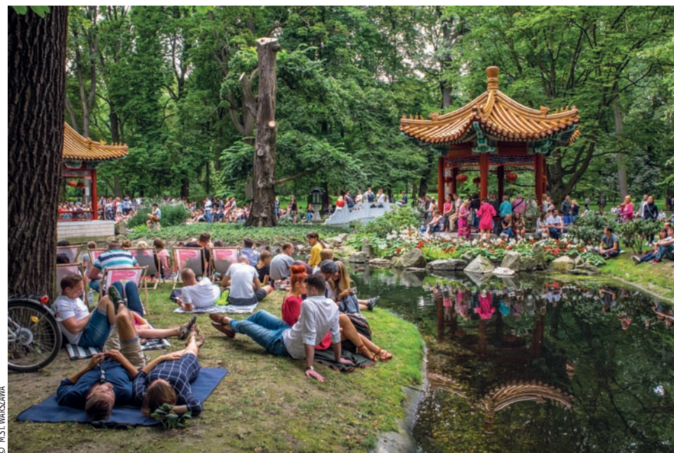
▲ Koncert jazzowy odbywający się na terenie Łazienek Królewskich w rejonie Ogrodu Chińskiego

Zakłęta w zabytkach niezwykła historia miasta przeplata się tu z nowoczesnymi budynkami, gdyż Warszawa to dynamicznie rozwijająca się metropolia. O ogromne tereny zielone stanowiące ponad 30 proc. całej powierzchni stolicy i Wisła, dzika rzeka w sercu metropolii, stwarzają wiele