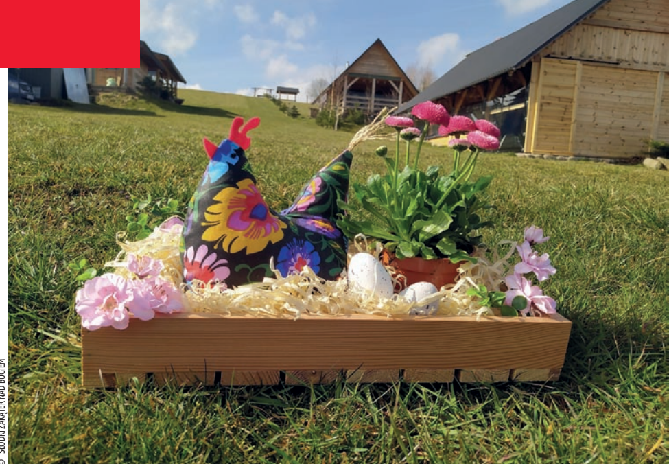
▲ Sielskie gospodarstwo „Stodki Zakątek nad Bugiem”

Miejsce to jest przyjazne rowerzystom. Znajduje się niedaleko Wschodniego Szlaku Rowerowego Green Velo. Do dodatkowych