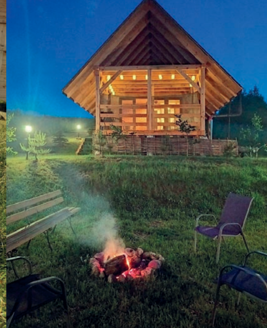
▲ Sauna w „Stodkim Zakątku nad Bugiem” w Klepaczewie