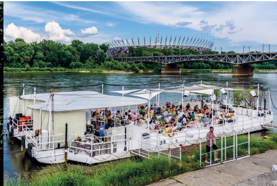
▲ Klub „BarKa” działa na barce zacumowanej u brzegów Wisły między mostem Świętokrzyskim i Średnicowym

Internauci z ponad 130 krajów oddali na Warszawę 142 tys. głosów i był to najwyższy wynik w historii plebiscytu European Best Destinations (do tej pory palmę pierwszeństwa dzierżyło portugalskie Porto ze 138 tys. głosów w 2017 r.). Drugie miejsce przypadło Atenom, które zdobyły 91 tys. głosów. W pierwszej piątce znalazły się jeszcze słoweński Maribor, Wiedeń i włoska Cittadella (prowincja Padwa). To nie tylko prestiż dla polskiej stolicy, lecz także duża