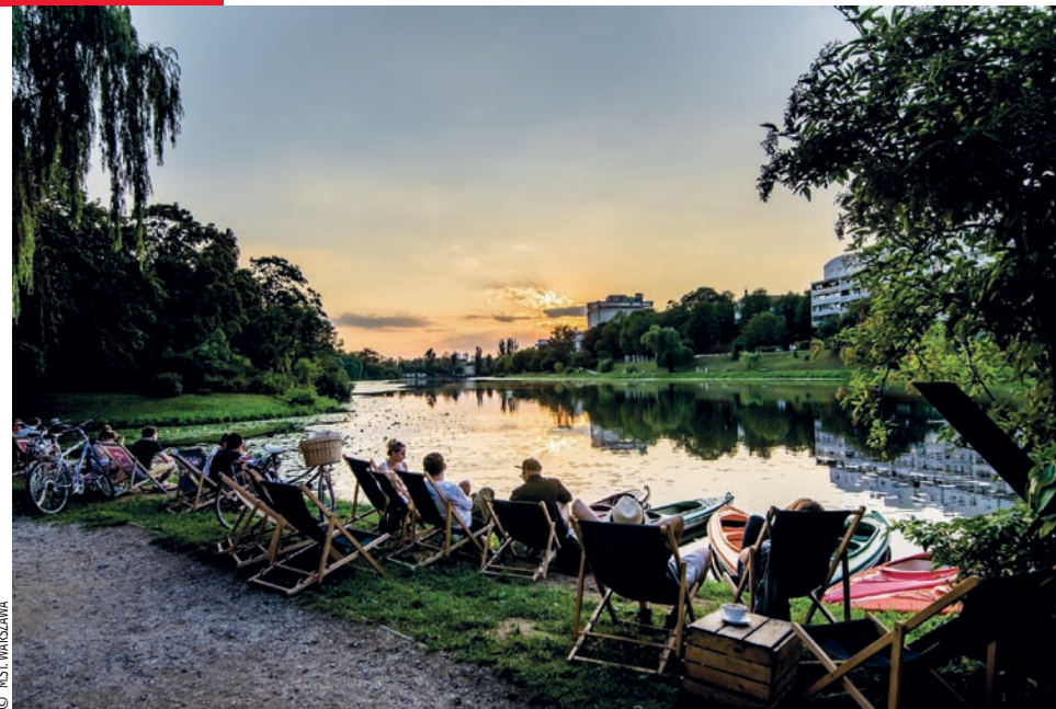
▲ Jezioro Kamionkowskie leżące w warszawskim Parku Skaryszewskim im. Ignacego Jana Paderewskiego

N ieważne, czy wybierzemy luksusowe ośrodki spa i wellness, eleganckie pałacowe wnętrza, miejsca mocy w Polskim Centrum Biowitalności, klimatyczne miejsca w nadbużańskiej krainie spokoju czy relaks w największym sadzie Europy – na pewno wszędzie znajdziemy tak potrzebne człowiekowi wyciszenie i spokój w harmonii z rytmem natury. Zajęcia jogi prowadzone w plenerze lub stodołę, jacuzzi pod chmurką, warsztaty łączące dobrodziejstwa przyrody z filozofią holistyczną – to tylko wybrane propozycje, które przywrócą nam radość życia i równowagę pomiędzy duszą a ciałem. Docerimy niezwykły świat roślin i skarbów natury, zdrową kuchnię witalną, śniadania na trawie w otoczeniu sadów owocowych czy rytuały zdrowia odbywające się pod gołym niebem w Witalnej Wiosce SPA w Chlewiśkach.