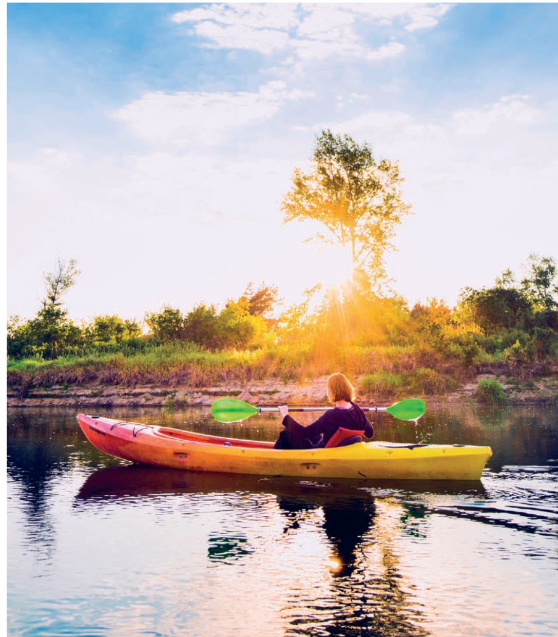
▼ Spływ kajakami rzeką Bug dostarcza wielu wrażeń

Rzeka Bug stanowi prawdziwy raj dla wodniaków. Poza kajakami można ją pokonać, wybierając rejs statkiem lub katamaranem, a jedną z większych atrakcji są spływy pontonami. Swoje miejsce znajdują również