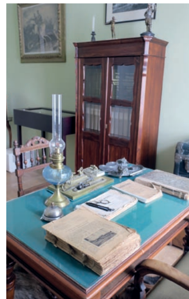
▲ Pokój pana domu w Muzeum Ziemiaństwa w Dąbrowie

w 1850 r. dla rodziny Dobrzyńskich późnoklasykistycznym dworze, który otaczają 150-letni zabytkowy park z alejami lip, dębów i grabów oraz sad, gdzie rosną stare odmiany jabłoni oraz nowe nasadzenia krzewów owocowych. Do tutejszych atrakcji na-