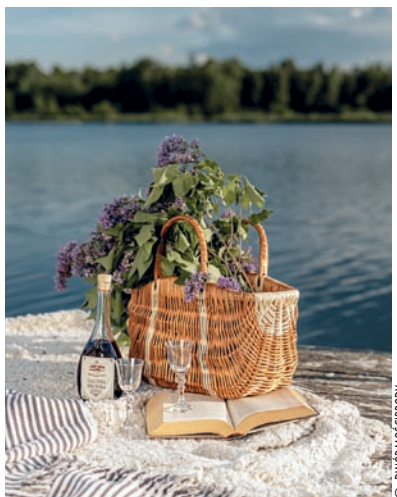
▲ Odpoczynek z książką nad stawem Dworu Mościbrody