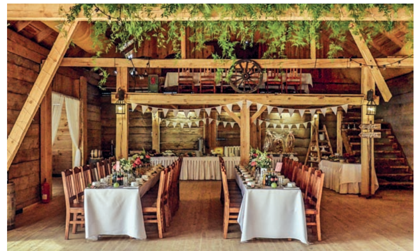
▲ Drewniana stodoła Dworu Mościbrody przeznaczona jest na organizację spotkań rodzinnych lub firmowych

nordic walking, wędkowania, plażowania czy podziwiania wspaniałych zachodów słońca na molo, czemu towarzyszą rechot żab i cykanie świerszczy. Można się także zaszyć z książką wśród starych drzew, bo od dawna wiadomo, że kąpiele leśne odstresowują, wzmacniają odporność organizmu i dodają pozytywnej energii.