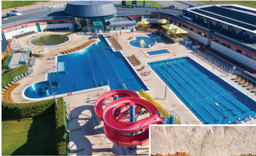
FOT. TERMY MSZCZONÓW (2)

W kompleksowej ofercie miejsca znajduje się 130 zabiegów, w tym 16 masaży: od masażu głowy, liftingującym aromatyczną świecą, masaż ciała masłem shea po masaż refleksologiczny stóp. Na szczególną uwagę zasługują profesjonalne łóżka do masażu (np. do rytuału hamam, wodne z koloroterapią, piaskiem