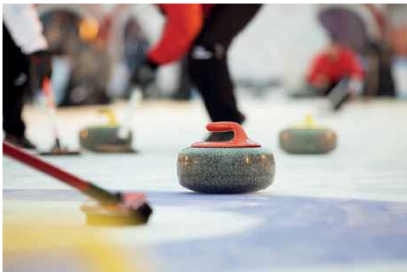
▼ Curling stał się oficjalną dyscypliną zimowych igrzysk olimpijskich dopiero w 1998 r., w Nagano

zamrożonej tafli jeziora swoich sił próbowali pierwsi łyżwiarze. Ostatni raz Balaton nadawał się do tego w 2017 r., kiedy zima pokryła go bezpieczną, grubą warstwą lodu. Jednak nic straconego, ponieważ jak donosi portal Hungary Today, 30 listopada 2024 r. w miejscowości Balatonlelle, oddalonej o ok. 35 km od Siófoku, otwarto największe po południowej stronie jeziora sztuczne lodowisko o powierzchni 1,2 tys. m 2 , które będzie dostępne dla łyżwiarzy przez 60 dni. Dodatkowo z myślą o odwiedzających z Węgier i zagranicy przygotowano ogrzewany namiot festiwalowy o pojemności tysiąca osób, z bogatymi programami rozrywkowymi, rodzinnymi i dziecięcymi oraz imprezami tanecznymi. Interesującą atrakcją stanowi również lodowisko otwarte na dachu 4-gwiazdkowego Hotelu President położonego w samym centrum Budapesztu. Goście hotelowi mają tu wstęp wolny. Na miejscu