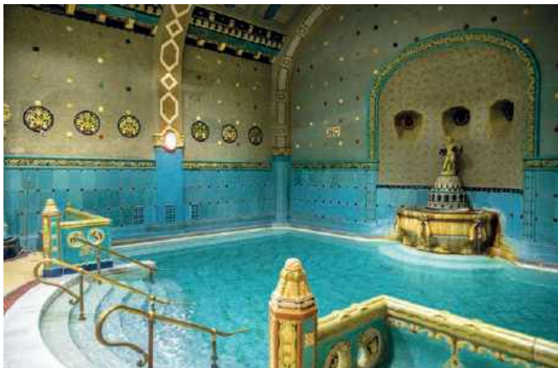
▲ Łaźnie Gellerta powstały w latach 1912–1918, ale tutejszych wód leczniczych używano co najmniej od średniowiecza

W zależności od pory roku wykorzystanie wody zmienia się. Zawsze jednak pozostaje centralnym elementem wielu form relaksu oraz podejmowanej aktywności fizycznej.