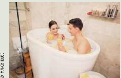
▼ Zdrowotna kąpiel ofuro w japońskim stylu

Poza tym Manor House SPA słynie z szerokiego wyboru kąpeli zdrowotnych i relaksacyjnych : od mineralnych kąpeli z biszofitem potawskim, żywicznych, magnezowych i gęboko oczyszczających, przez kąpiele w kruskach soli himalajskiej lub ze sproszkowaną srebrzystą perłą, aż po luksusowe kąpiele