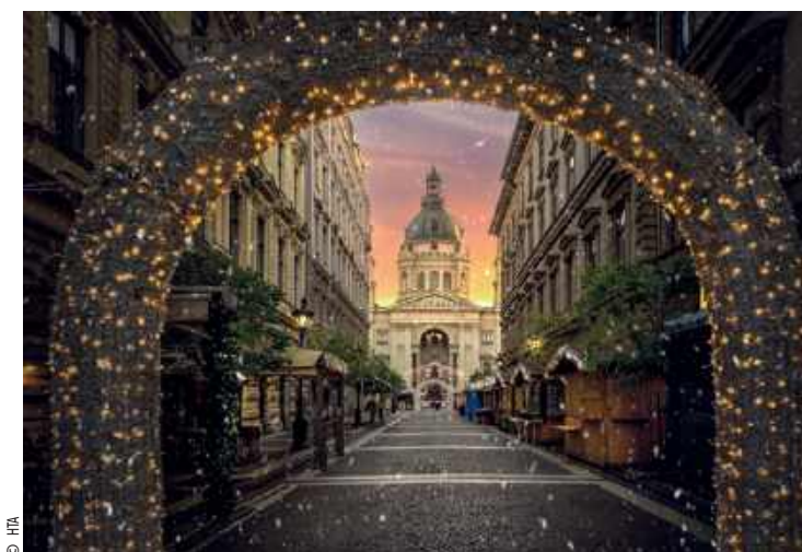
▲ Jarmark bożonarodzeniowy przed Bazyliką św. Stefana w stolicy Węgier