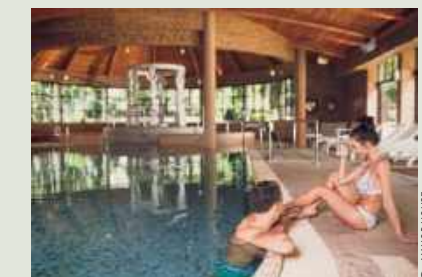
▼ Relaks na basenie z atrakcjami wodnymi