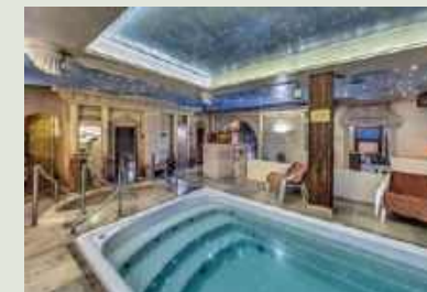
▼ Rytuały saunowe w Łazienkach Rzymskich