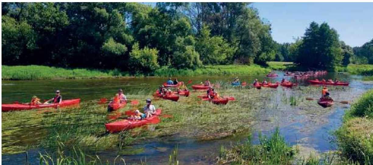
▲ Zachodnią granicę Nadbużańskiego Parku Krajobrazowego, a właściwie jego otuliny, stanowi dolina rzeki Liwiec ▼ Spływy mazowiecką rzeką Wkrą (dopływem Narwi)