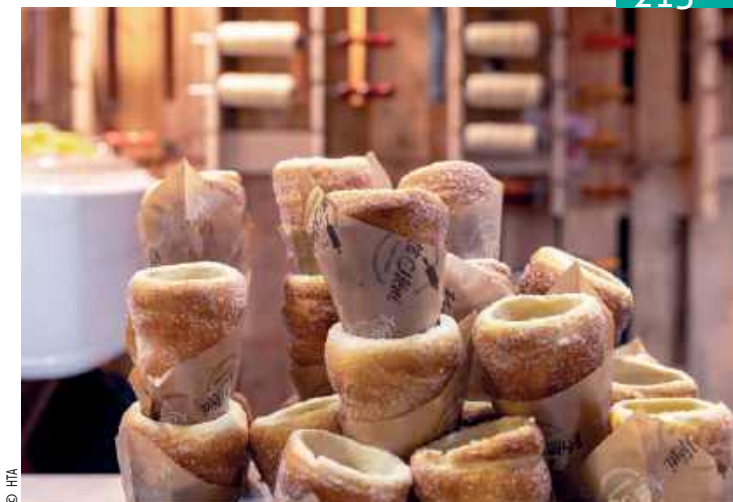
▲ Tradycyjny kurtőskalács, gorący i chrupiący, to idealny zimowy przysmak