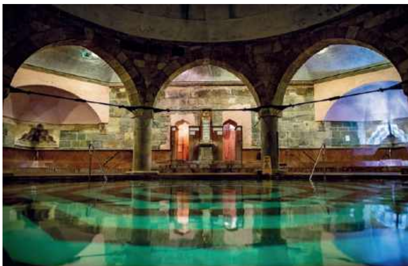
▲ Termy Rudas w pobliżu mostu Elżbiety w Budapeszcie ► Termy Széchenyiego w Parku Miejskim (Városliget)

« Woda to jeden z czterech żywiołów, esencja istnienia życia na Ziemi. Jak mawiał grecki filozof Tales z Miletu – jest istotą wszystkiego. A to dlatego, że wszystko pochodzi z wody i wszystko w niej się kończy. Odgrywa zatem istotną rolę również w turystyce. I to, co najważniejsze, przez okrągły rok, oferując szeroki wachlarz atrakcji dla osób w każdym wieku. »