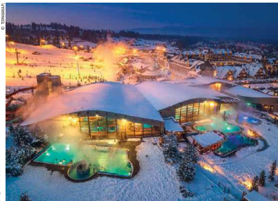
▲ Manor House SPA – odnowa biologiczna w Witalnej Wiosce SPA, w której skład wchodzi m.in. sauna ziołowa

wraz z Mantrowaniem”. Ich dźwięki naturalnie dostrajają organizm wyczerpany po całym dniu licznych zmagani. W holistycznej filozofii Manor House SPA wpisują się też regularne sesje jogi, które jak mały co podkreślają znaczenie harmonii umysłu i ciała. Cały kompleks pałacowo-parkowy Manor House SPA – Pałac Odrowążów w mazowieckich Chlewickach stanowi wyjątkową strefę relaksu, zlokalizowaną w otoczeniu zabytkowego parku, w którym znajdziemy także pomniejszoną replikę słynnego kamiennego ogrodu służącego medytacji zen przy buddyjskiej świątyni Ryōan-ji (Świątyni Uspokojonego Smoka) w Kioto. Jak widać, miejsce czerpie z różnorodnych tradycji