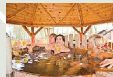
▼ Odnowa biologiczna w Witalnej Wiosce SPA

Z hydroterapii w Manor House SPA można skorzystać np. w bechchlorowym basenie z rwącą rzeką, podwodnymi gejzerami, masażerami karku i kręgosłupa oraz jacuzzi, a w Łazienkach Rzymskich w basenie swim z przeciwprądami, prysznicami wrażeń i balii z zimną wodą – idealną do schłodzenia ciała po saunowaniu. Niepowtarzalne przeżycie stanowią nocne koncerty w basenie na kamertony, misy kryształowe i tybetańskie z mantrowaniem . Wibracje dźwięków, wzmacniane przez wodę, wpływają korzystnie na zdrowie i samopoczucie, sprzyjając głębokiemu odprężeniu oraz harmonizacji