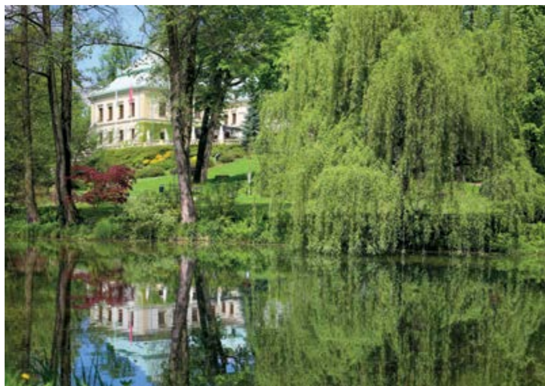
TEKST I ZDJĘCIA MANOR HOUSE SPA**** PAŁAC ODROWĄŻÓW*****

Współczesny świat pędzi, a z nim my. Atakuje nas mnogością informacji oraz przytłacza nadmiarem obowiązków. Żyjemy pod presją czasu, coraz częściej brak nam uważności na ludzi i istotne sprawy. Towarzyszy nam bezsenność, zmęczenie, przewlekły stres, a to odbija się na naszym samopoczuciu. Razem z Manor House SPA – najlepszym holistycznym hotelem SPA w Polsce – zabieramy Państwa w podróż po zdrowie.