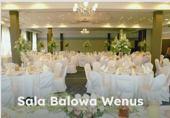
Sala Balowa Wenus

Elegancja, przestronność i zachwycający widok