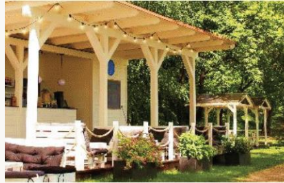
Beach Bar nad brzegiem Czwartek-Niedziela 11.00-20.00

CZWARTEK 18.30-22.00 Wspólna salsa i bachata na plaży z DJ na żywo