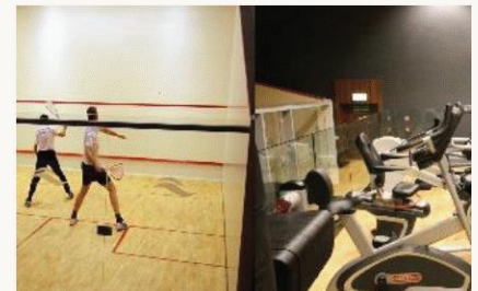
Sala fitness, siłownia, squash

Rekomendujemy wcześniejszą rezerwację zabiegów