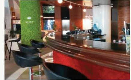
Nurt Bar w hotelowym lobby Codziennie 10.00-23.30 (w sobotę do 2.00)

CZWARTEK 18.30-22.00 Wspólna salsa i bachata na plaży z DJ na żywo