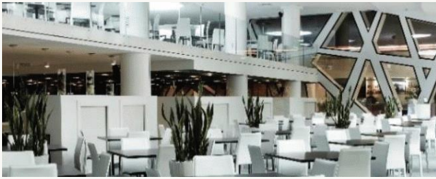
Restauracja Kaskada Śniadania

Śniadania: Czwartek-Sobota 8.00-11.00 Poniedziałek-Środa 7.00-10.00