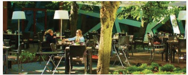
Restauracja Aruana w ogrodzie

Śniadania: Czwartek-Sobota 8.00-11.00 Poniedziałek-Środa 7.00-10.00