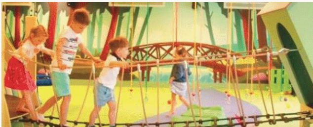
Narvilandia sala zabaw dla dzieci z animacjami

WAŻNE INFORMACJE O POSIŁKACH DLA GOŚCI Z PAKIETÓW POBYTOWYCH „DŁUGI WEEKEND CZERWCOWY” w opcji HB. Kolacje od środy do soboty w godz. 18.00-21.00 dla Gości z pakietu DŁUGI WEEKEND CZERWCOWY są organizowane w formie bufetu w Restauracji Kaskada.