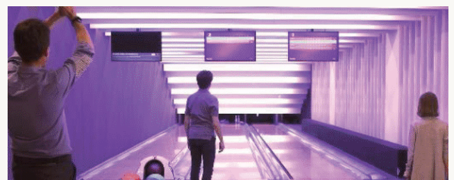
Strefa Rozrywki Laguna

Szczegółowy godzinowy program dostępny u animatorek