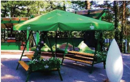
Green Bar przy zejściu nad rzekę Czwartek 14.00-21.00 Piątek- Sobota 12.00-21.00

PIĄTEK, SOBOTA 19.00-22.00 Muzyka na żywo