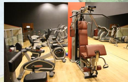
Sala fitness | siłownia | squash

Rekomendujemy wcześniejszą rezerwację zabiegów