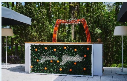
Secret Garden Sobota 12.00-22.00 Tarasy Laguna