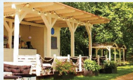
Beach Bar nad brzegiem Piątek 14.00-20.00 Sobota 12.00-20.00 Niedziela 11.00-17.00