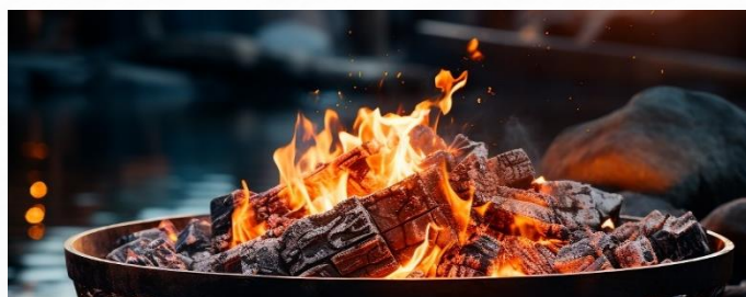
Zestaw na ognisko Niedziela 16.00-17.30

w cenie 50 zł* dostępny przy Zejściu nad Narew *nie dotyczy Gości z pakietu „Wielkanoc nad Narwią”.