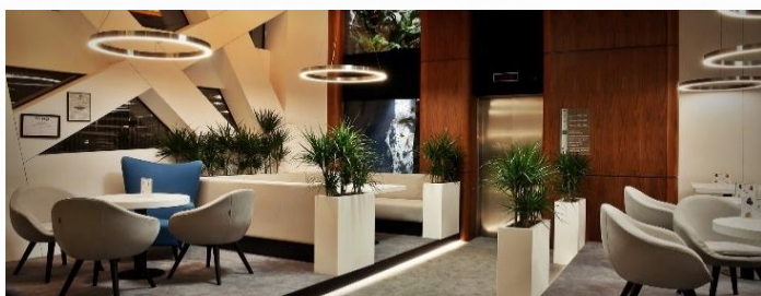
Nurt Bar w lobby