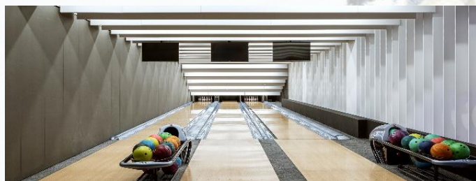
Strefa Rozrywki Laguna

Codziennie nieodpłatnie: stoły do ping-ponga, piłkarzki, dart na antresoli. Kregle, bilard i snooker (za dodatkową opłatą, po uprzedniej rezerwacji). Dyskoteka z DJ-em piątek -niedziela 21.00-2.00. Disco bar piątek 18.00-2.00 oraz sobota-niedziela 15:00-02:00