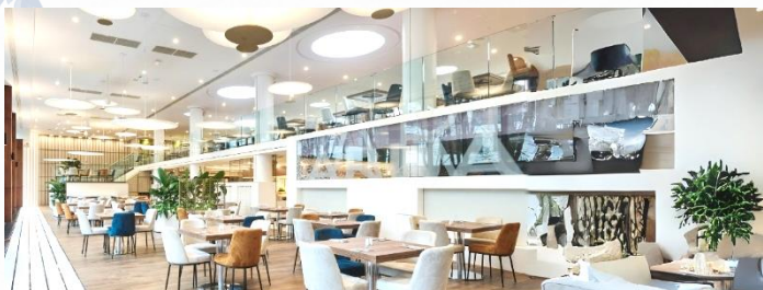
Restauracja Kaskada Śniadania

Kolacja w formie bufetu w piątek w godz. 18.00-21.00 w restauracji Kaskada, Śniadanie w formie bufetu w sobotę w godz. 8.00-11.00 w restauracji Kaskada, Uroczysta kolacja w formie bufetu w sobotę w godz. 18.00-21.00 w sali Amazonka, Śniadanie Wielkanocne w formie bufetu w niedzielę i poniedziałek w godz. 8.00-12.00 w sali Amazonka, Bufet wielkanocnych słodkości z warsztatami dla dzieci w niedzielę w godz. 14.00-16.00 w restauracji Kaskada - Antresola, Ognisko w niedzielę w godz. 16.00-17.30 | Zejście nad Narew Uroczysta kolacja w formie bufetu w niedzielę w godz. 18.00-21.00 w sali Amazonka, Zastrzegamy sobie prawo do zmiany formy serwisu posiłków ze względu na liczbę przebywających w hotelu Gości.