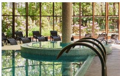
Basen z jacuzzi i saunami

Codziennie nieodpłatnie: stoły do ping-ponga, piłkarzki, dart na antresoli. Kregle, bilard i snooker (za dodatkową opłatą, po uprzedniej rezerwacji). Dyskoteka z DJ-em piątek -niedziela 21.00-2.00. Disco bar piątek 18.00-2.00 oraz sobota-niedziela 15:00-02:00