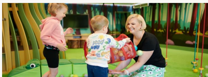
Narvilandia sala zabaw z animacjami

WAŻNE INFORMACJE O POSIŁKACH DLA GOŚCI Z PAKIETÓW POBYTOWYCH „MAJÓWKA NAD NARWIĄ” w opcji HB. Kolacje od wtorku do soboty w godz. 18.00-21.00 dla Gości z pakietu MAJÓWKA NAD NARWIĄ HB są organizowane w formie bufetu w Restauracji Kaskada. Zastrzegamy sobie prawo do zmiany formy serwisu posiłków ze względu na liczbę przebywających w hotelu Gości.