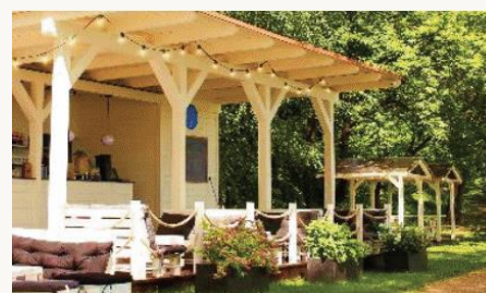
Beach Bar nad brzegiem

Wtorek 15.00-22.00 Środa-Sobota 12.00-22.00