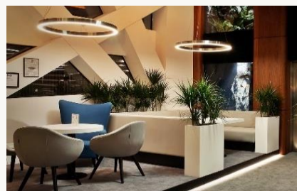
Nurt Bar w lobby

Codziennie 13.00-22.30 w przypadku niepogody serwis jest przeniesiony do Restauracji Kaskada