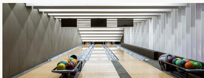
Strefa Rozrywki Laguna

Opieka dla dzieci od 4 lat Wtorek-Sobota 09.00-20.00 Niedziela 09.00-16.00