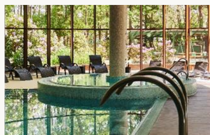
Basen z jacuzzi i saunami

Codziennie nieodpłatnie: stoły do ping-ponga, piłkarzki, dart na antresoli. Kregle, bilard i snooker (za dodatkową opłatą, po uprzedniej rezerwacji). Dyskoteka z DJ-em wtorek- sobota 21.00-2.00 Disco bar wtorek-sobota 18.00-2.00