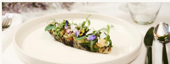
Restauracja* Aruana w ogrodzie

Wtorek 7.00-10.00 Środa-Niedziela 8.00-11.00