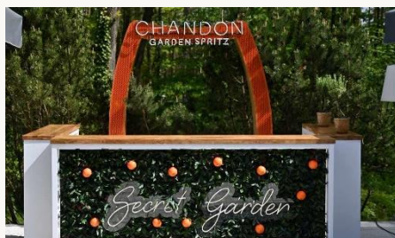
Secret Garden Tarasy Laguna

Wtorek 15.00-22.00 Środa-Sobota 12.00-22.00