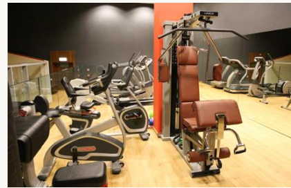
Sala fitness | siłownia | squash

Wtorek-Sobota 10.00-21.00 Niedziela 9.00-18.00 Rekomendujemy wcześniejszą rezerwację zabiegów