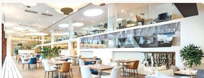
Restauracja Kaskada Śniadania

Wtorek 7.00-10.00 Środa-Niedziela 8.00-11.00