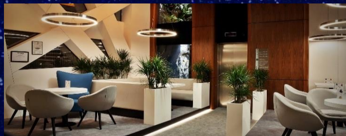
Nurt Bar w lobby Codziennie 10.00-23.30

Codziennie 13.00-22.30* Niedziela w dn. 31.12 | 13.00-20.00