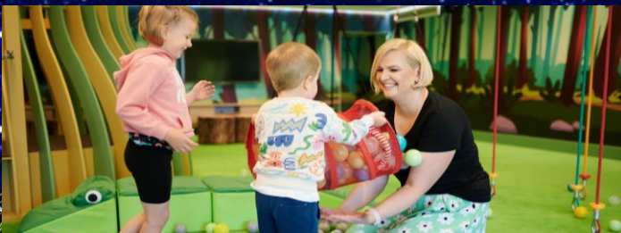
Narvilandia sala zabaw z animacjami

Piątek 16.00-20.00 Sobota 09.00-20.00 Niedziela 09.00-18.00 Poniedziałek 09.00-20.00