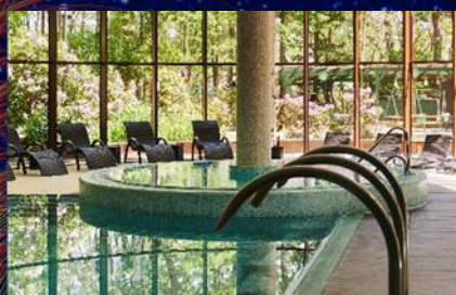
Basen z jacuzzi i saunami

Codziennie nieodpłatnie: stoły do ping-ponga, piłkarzyki, dart na antresoli. Kregle, bilard i snooker (za dodatkową opłatą, po uprzedniej rezerwacji). Dyskoteka z DJ-em piątek, sobota 21.00-2.00. Disco bar piątek, sobota, 18.00-2.00.