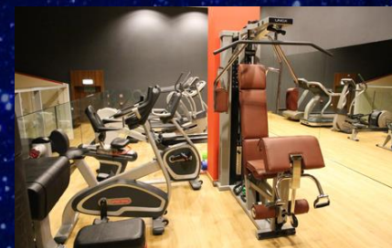
Sala fitness | siłownia | squash

Rekomendujemy wcześniejszą rezerwację zabiegów