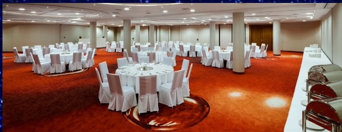
Sala Narew Śniadania

Kolacja sylwestrowa w formie bogatego bufetu ze stacjami live oraz pakietem alkoholi w niedzielę w godz. 20.00-04.00 w sali Amazonka, Noworoczne śniadanie w formie bufetu w poniedziałek w godz. 8.00-12.00 w Sali Narew, Brunch sylwestrowy w formie bufetu w niedzielę w godz. 15.00-17.00 w Sali Narew, Kolacja w formie bufetu w sobotę w godz. 18.00-21.00 w Sali Narew, (dla pakietu z 2 noclegami) Śniadanie w formie bufetu w niedzielę w godz. 8.00-11.00 w Sali Narew, (dla pakietu z 2 noclegami) Zastrzegamy sobie prawo do zmiany formy serwisu posiłków ze względu na liczbę przebywających w hotelu Gości.