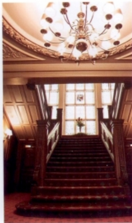
FENÊTRE SUR GREEN