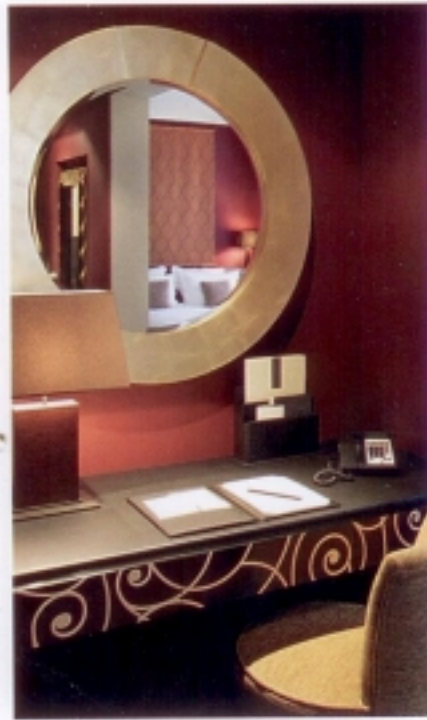
ENVERS DU DÉCOR