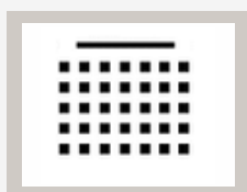
KINOWE do 70 osób