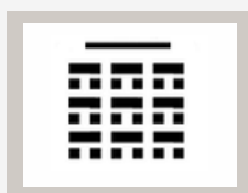
SZKOLNE do 48 osób