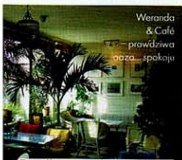
Weranda & Café — prawdziwa oaza... spokoju