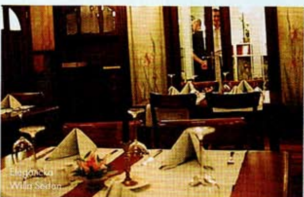
Elegancka Willa Sedan

Nowo otwarta Villa Bohema łączy artystyczny klimat Kazimierza z nowoczesnymi udogodnieniami SPA. W restauracji spróbujecie m.in. wołowiny z kaszтанami i filetów z piersi bawonta. Dla dbających o linię dietetyczne menu. Dwójka 340 zł. Ul. Małachowskiego 12; www.spakazimierz.pl