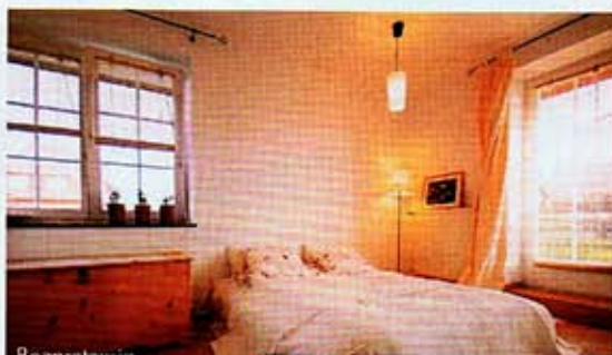
Bezpretensjonalna Willa Toscana

Opcja dla warszawian, którzy wyjazd we dwoje muszą odłożyć na później. Idealny adres na randkę to Weranda & Café. Miejsce nastrojowe i przytulne. Polecamy: farfalle elba, grzane wino na miodzie z pomarańczami i gruszek w sosie waniliowym. Ul. Jana Pawła II 3a, rezerwacje, tel. (0 22) 758 90 53.